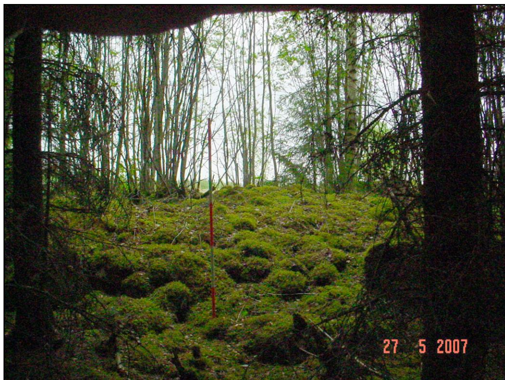
Viljelyröykkiö B (1)