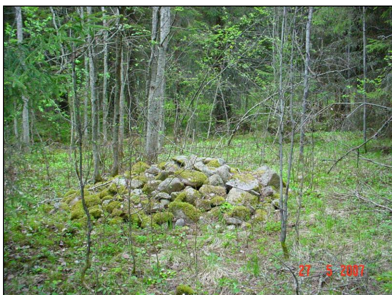
Viljelyröykkiö A (1)