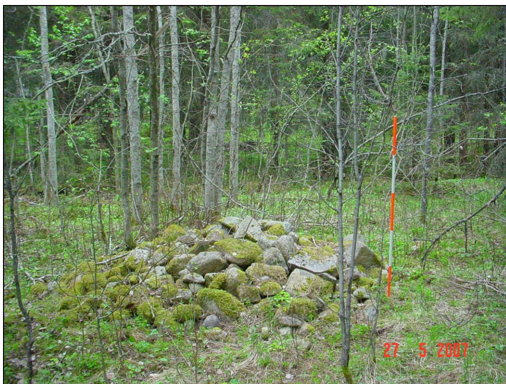
Viljelyröykkiö A (3)