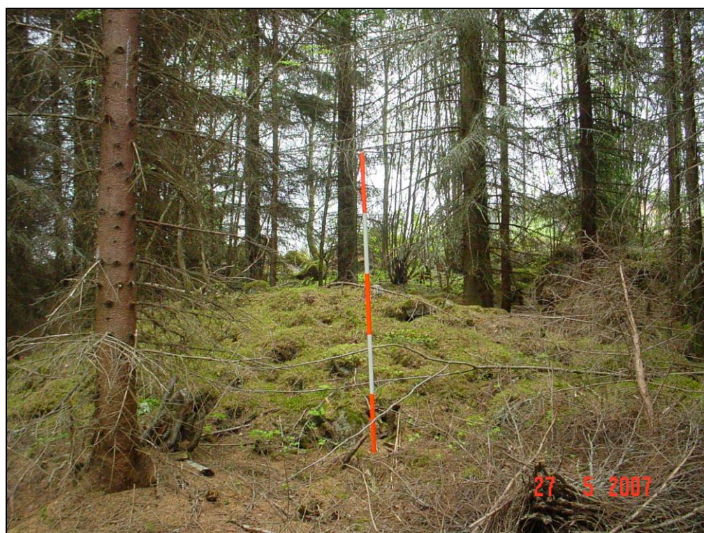
Viljelyröykkiö B (2)