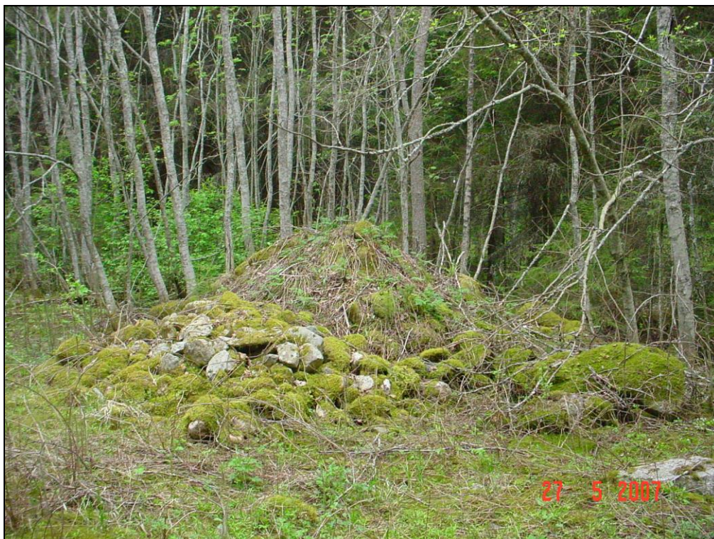
Viljelyröykkiö A (2)