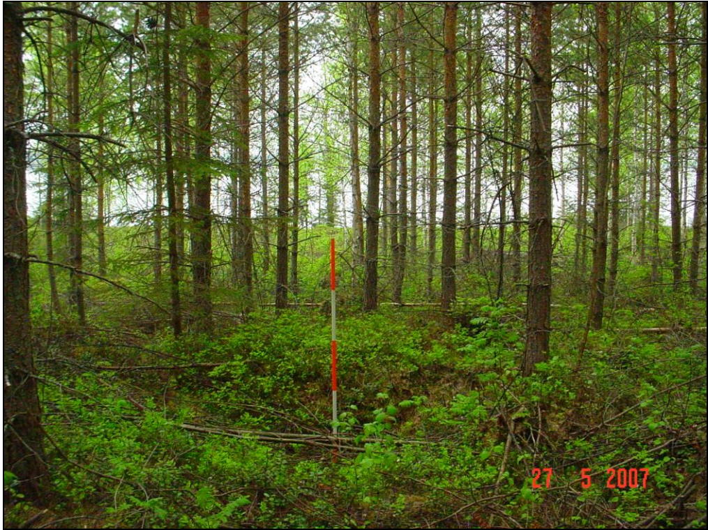
Hiilimiilun jääne C